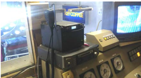
運転室内の索道無線機